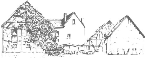
Bandanhof - Franz & Fries GbR - Rappershäuser Straße 9 - 97640 Hendingen